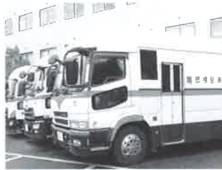
バスによる移動健診