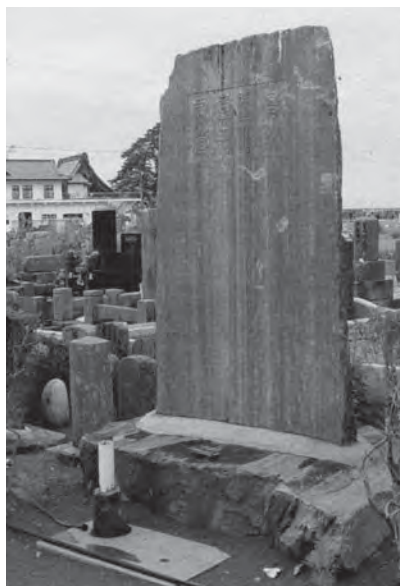
眞田喜平太の墓碑銘を刻んだ石碑(石巻市門脇二丁目 西光寺)

薩長を中心とする藩閥政治の中で、それ等に勝るとも劣らぬ活躍をした富田鐵之助は、戊辰戦争後虐げられてきた郷土の出世頭であり、支柱とも言える人物でした。端的に言えば、富田鐵之助は、世のため人のために生きた偉人であると思います。