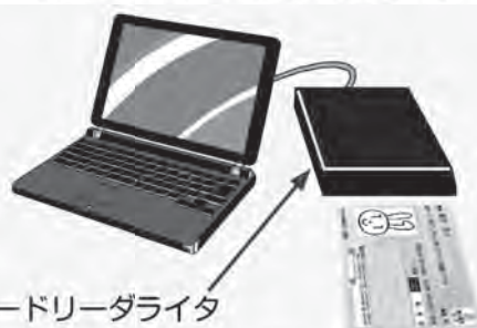
ICカードリーダライタ

※マイナンバーカードの交付に関するご質問については、住民票のある市区町村窓口へお問合せください。