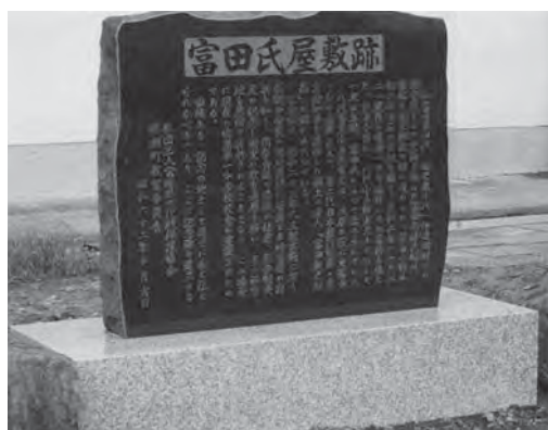
富田家屋敷跡の石碑 東松島市立鳴瀬未来中学校（旧鳴瀬第一中学校）

に師事し西洋砲術を学んでいます。その後、藩の命令で江戸でも砲術と蘭学、蒸気機械術、海軍術を学びました。