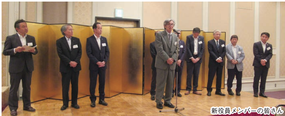
新役員メンバーの皆さん